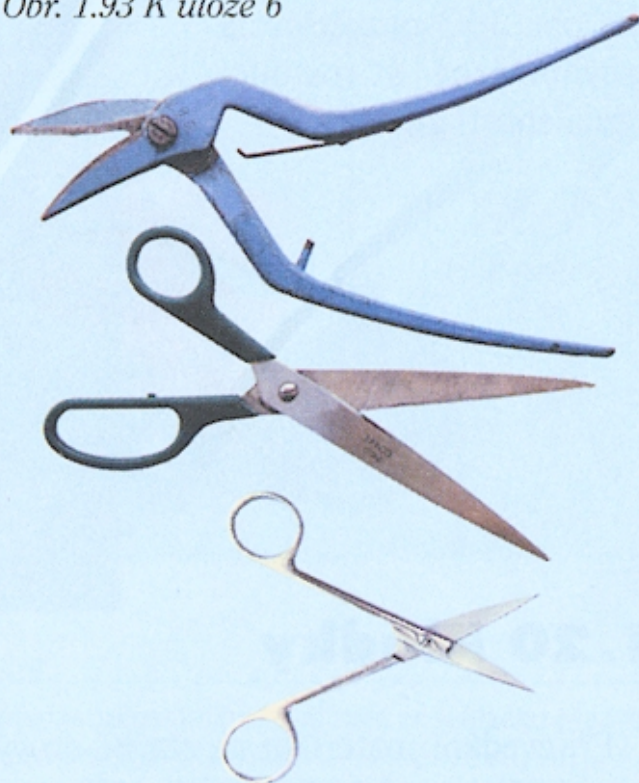
Obr. 1.93 K úloze 6