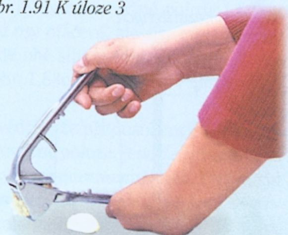
Obr. 1.91 K úloze 3